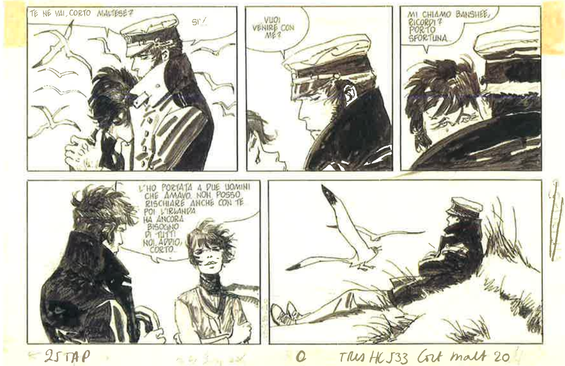
Cong SA Corto Maltese, Concerto in O' minore per arpa e nitroglicerina