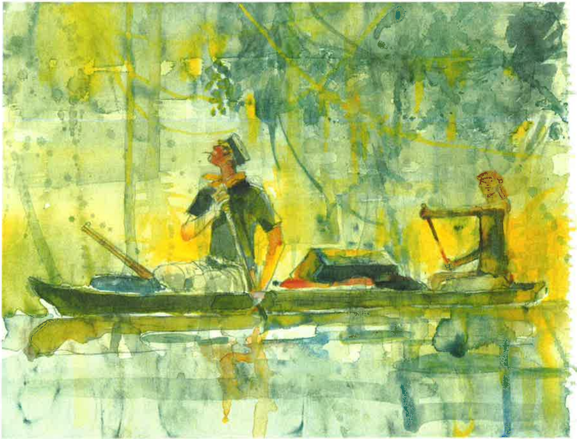
Cong SA Corto Maltese, Memorie