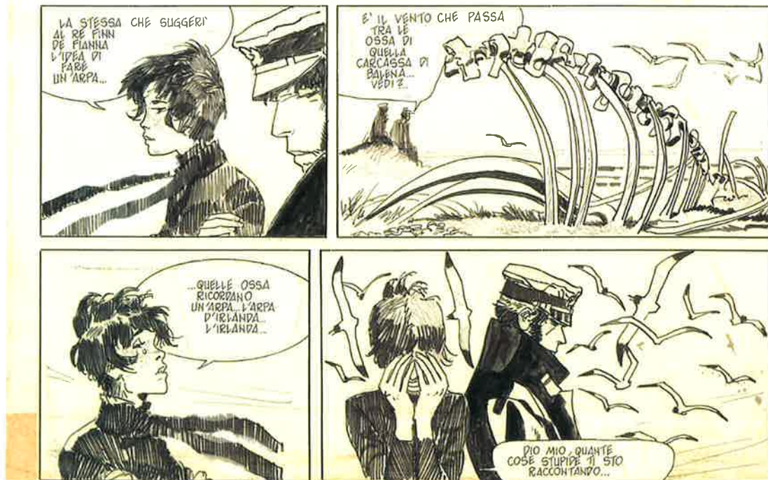
Cong SA Corto Maltese, Concerto in O' minore per arpa e nitroglicerina