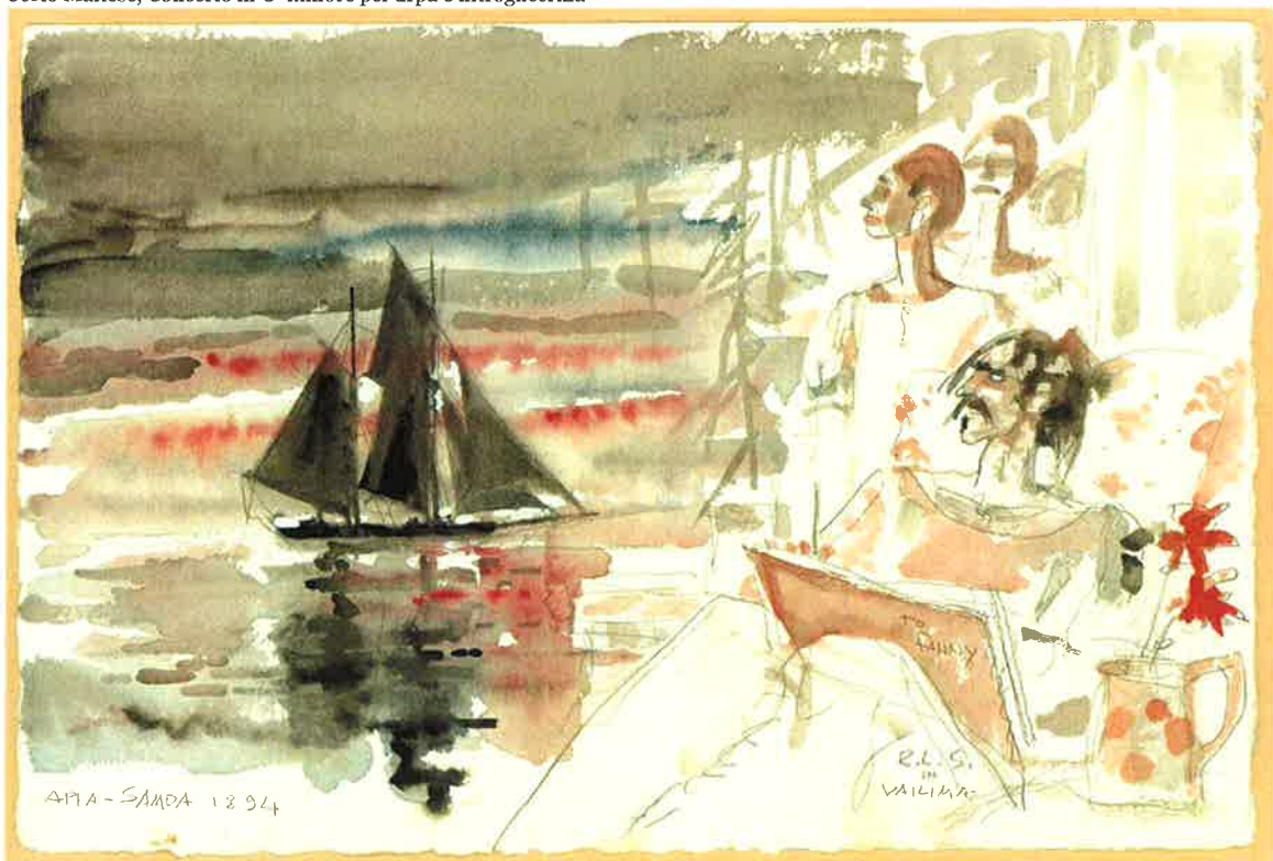
Cong SA Robert Louis Stevenson a Vailima, Apia, Avevo un'appuntamento